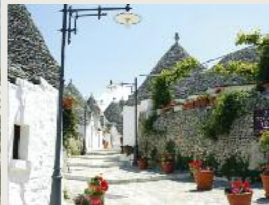
A sinistra il borgo di Apricale in Liguria, dove si trova l'Albergo diffuso "Muntaecara" A fianco l'Albergo diffuso Trulli Holiday ad Alberobello

Secondo Cacciari si può parlare di una complementarità per cui «il riconoscimento, la gestione e la rivendicazione dei beni comuni rappresentano una messa in pratica delle politiche della decrescita. Decrescita è un'indicazione di rotta e le politiche a favore dei beni comuni sono la messa in pratica di questa indicazione». Riguardo alla loro definizione, invece, Cacciari concorda con Ugo Mattei nel sostenere che «non sono una nuova categoria merceologica, ma ciò che le popolazioni e i gruppi sociali decidono essere indispensabili al loro buon vivere: sono sia quelli naturali – acqua, suolo, aria –, che devono essere di libero accesso, sia quelli cognitivi: i beni culturali, i lasciti del lavoro e dell'inveniva delle generazioni precedenti. Le cosiddette infrastrutture culturali e civili, come pure i beni tecnologici e internet». Non a caso un grande contributo al riconoscimento dei cosiddetti commons è giunto dalle comunità che si battono per l'accesso libero alla Rete. Infine «beni comuni sono i codici e le regole comporta-