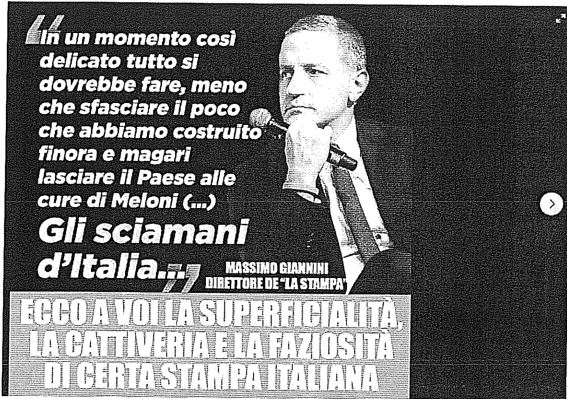
Lo screenshot del post pubblicato su Facebook da Giorgia Meloni

«Il direttore de "La Stampa" Massimo Giannini, non un qualunque Gad Lerner (le cui valutazioni violente e ridicole, che mostrano la pochezza delle idee, non suscitano da parte mia alcun interesse), mi definisce oggi uno "sciamano" d'Italia.