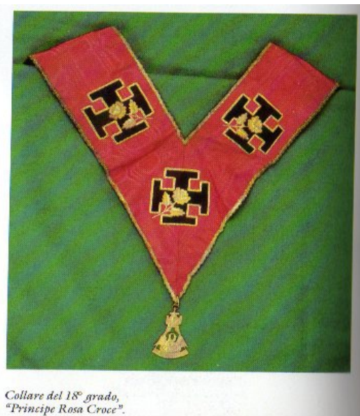
Collare del 18° grado, "Principe Rosa Croce".

A sinistra: simbolo massonico grado 18° "Sovrano Principe Cavaliere Rosa+Croce o Cavaliere dell'Aquila e del Pellicano".